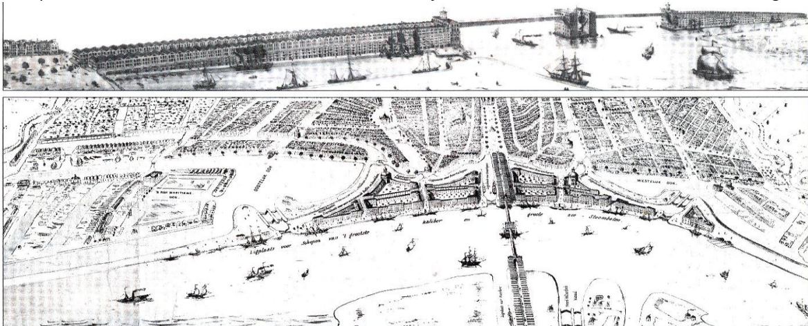
Brug over 't Y, ontwerp van J. Galman . Niet alleen een brug maar een compleet stadsvernieuwingsproject.

Dus op naar het Gemeente Archief in Amsterdam om te kijken of ze vader en zoon Kater niet waren vergeten.